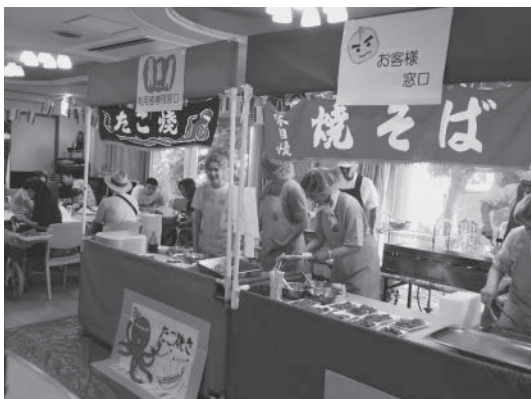
屋台 地区福祉会の皆さんありがとう