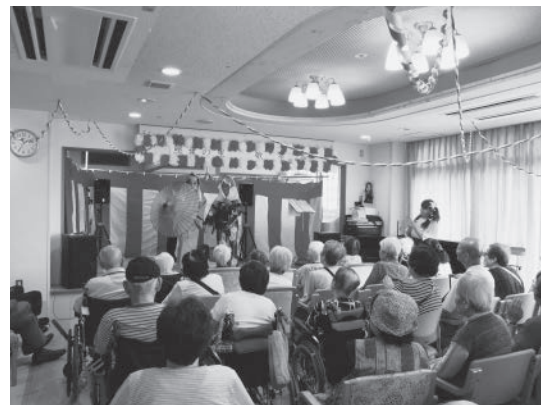
平成笹川一座の演芸

団らんの昼食会。食事は豪華な幕の内。 食事の後は、ボランティアグループ「平成笹川一座」の皆さんによる楽しい演芸を楽しんでいただきました。