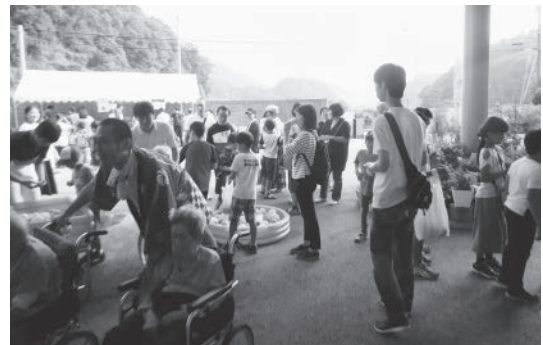
玄関前のゲームコーナー