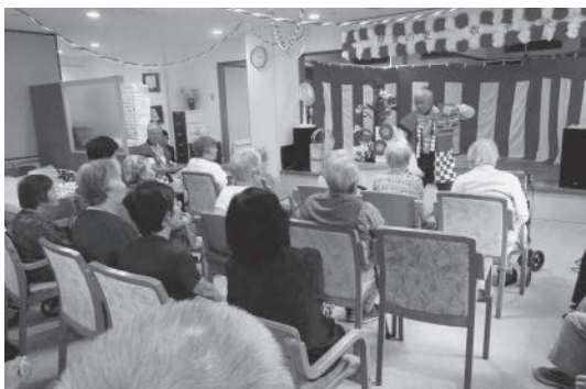
元気アップクラブの皆さん